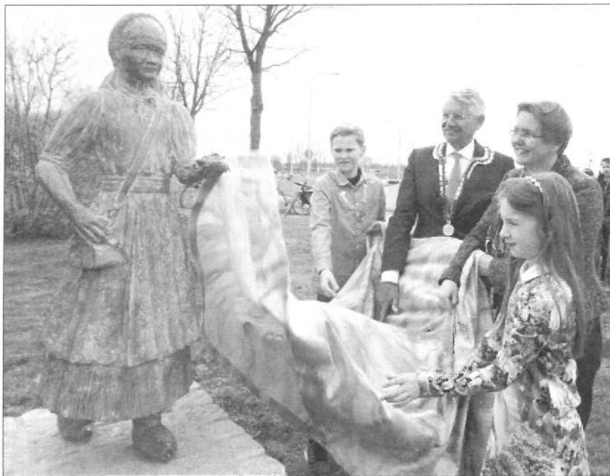
Onthulling van Kruuzemuntje.

Daar moest Cremer het mee doen. Als u het mij vraagt, zegt deze passage meer over Multatuli zelf dan over Cremer. Op den zolder moge dan misschien niet tot de meest hoogstaande literatuur gerekend kunnen worden in termen van spanning, beeldspraak en stijl, maar ik twijfel geen moment aan de oprechte bedoelingen van Cremer. Hij was nauw verbonden met de provincie, die nu getroffen werd door een vreselijke ramp. Het moet hem aan het hart zijn gegaan dat talloze mensen uit zijn geboortestreek verdronken waren of alles verloren hadden. Prostitueerde Cremer zich werkelijk voor de kunst? Ik geloof er niets van. De opmerking zegt meer over Multatuli dan over Cremer.